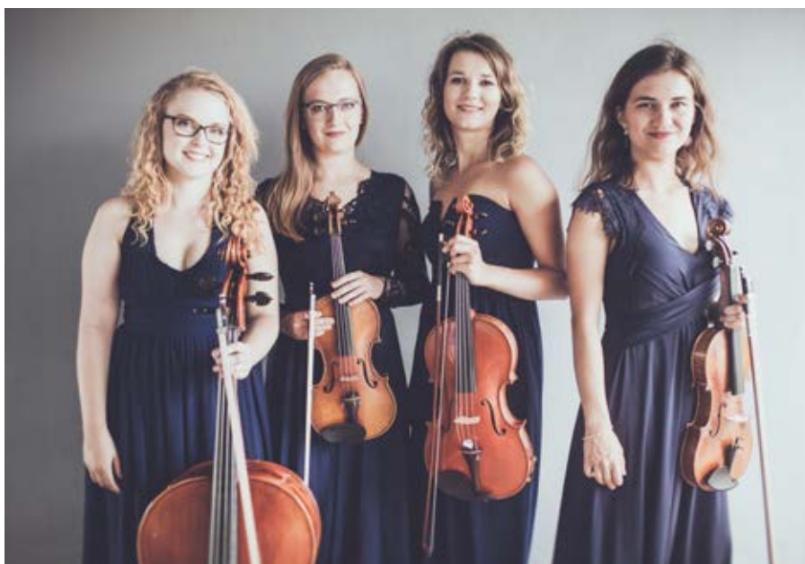
Kwartet smyczkowy Al Pari