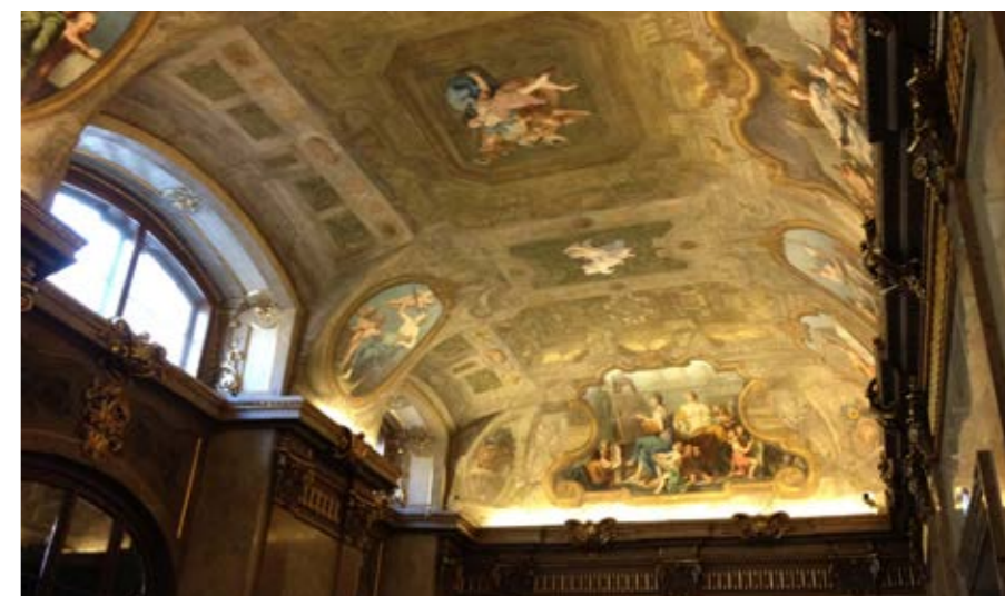
Barokowy fresk na sklepieniu świątecznej sali wiedeńskiego pałacu Lobkowitza.