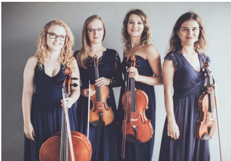
Kwartet smyczkowy Al Pari